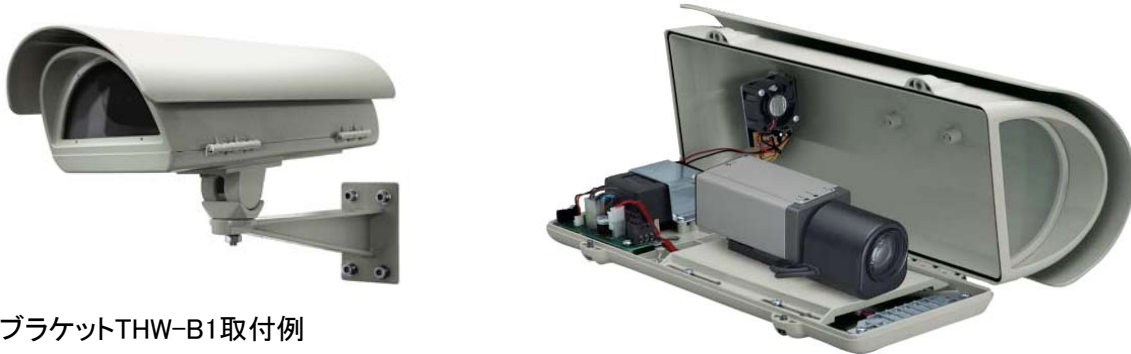
※ブラケットTHW-B1取付例