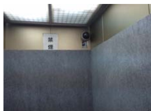
エレベータ籠内カメラ