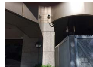
ゴミ置場、非常階段カメラ

撮像素子:1/3"プログレッシブスキャンCMOS 解像度:1080P/720P(切替可) 水平解像度:700本(アナログ) 最低照度:0.001lux(白黒/高感度モード) レンズ:2.8-10mm 赤外線照射距離:約10m 同軸伝送距離:120mまで 電源:DC12V(±10%) 700mA 寸法:W59xH63xD95mm