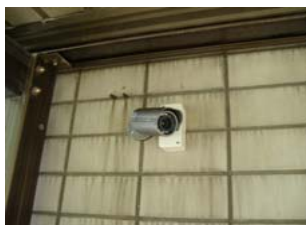
駐輪場赤外線投射カメラ