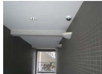
正面エントランス

閑静な本マンション周辺も近隣での事件があったり、防犯対策の強化の機運となりました。数社を比較の上、トータルコストも勘案し業者選定しました。録画確認も容易になり、更なる防犯効果のアップに期待しています。