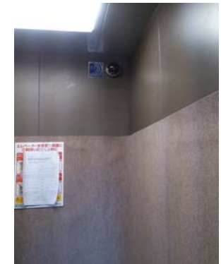
エレベーターカメラ

撮像素子:1/3"SuperHAD IP67 水平解像度:530本 最低照度:0.05lux S/N比:48dB以上 白色LED:8個 赤外線LED:12個 赤外線照射距離:15m 白色LED照射距離:10m レンズ:固定焦点6mm 電源:DC12V 3.36W