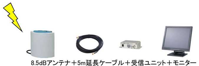
8.5dBアンテナ+5m延長ケーブル+受信ユニット+モニター

※信号が干渉される場合、アンテナの角度調整、 もしくは、チャンネルの変更を行ってください。